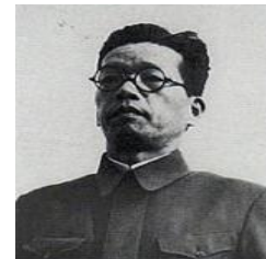
荒井退造 警察部長