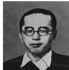
沖縄県知事の島田叡知事