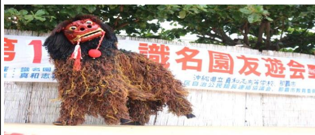
勇壮な上間の獅子