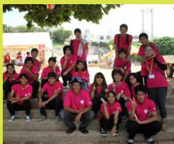
2017年の夏祭り、集合写真