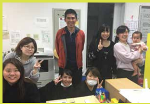
Jr ボランティア OG メンバーと。今年3月

私は中学1年生の終わり頃から高校卒業までの約5年間、Jr ボランティアの1期生として活動をしていました。初めてのボランティアという事もあり、職員の方と苦戦しつつも地元の歴史や文化に触れ、イベントや行事などを通して様々な経験をさせてもらいました。今はアルバイトとして、ボランティア時代とは少し違った目線で地域の方々と関わることができています。