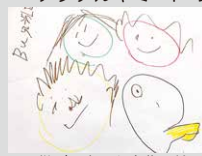
子供が販売した自作の絵

エジプトでは3月15日から外出制限が始まり、学校が9月まで休みになりました。飛行機も飛んでいません。仕事もテレワークで、食料品の買い出し以外は家族6人自宅で過ごしています。