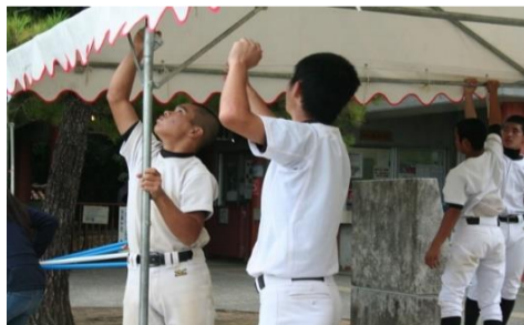
真和志高校野球部のボランティア