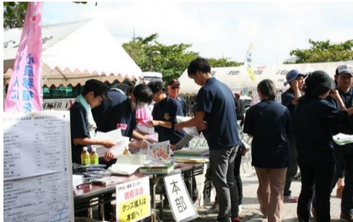
中・高校生のボランティア