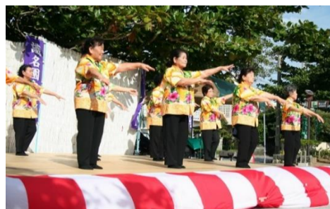
真地民謡愛好会による民謡