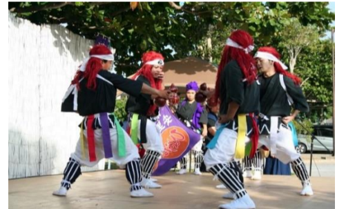
安里南之島保存会・ヒョータン踊り