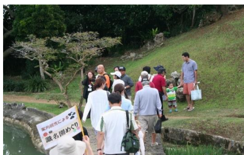
案内親方による識名園めぐり