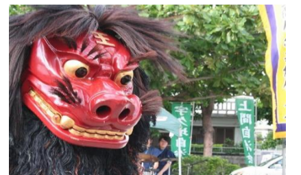
上間伝統芸能保存会による獅子舞