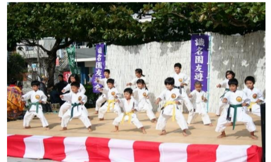
オープニングの空手演武