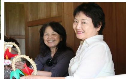
しめ縄づくり体験