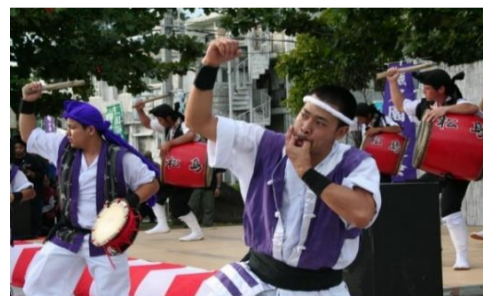
松島青年会によるエイサー