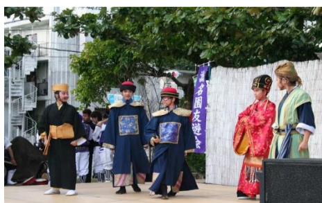
那覇青少年舞台プログラムによる 創作識名演劇